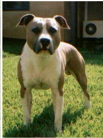
Tosa japonès (o tosa inu)