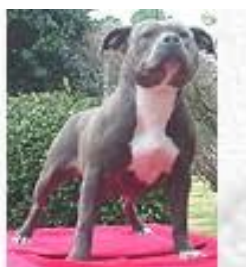
De presa canari