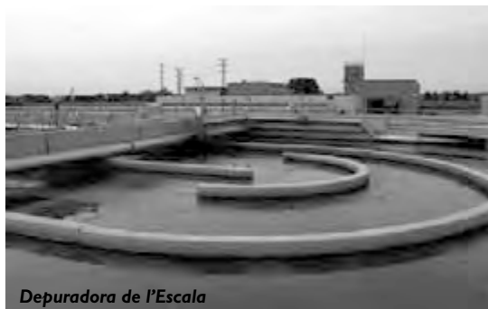
Depuradora de l'Escala

Des de l'ajuntament s'han fets els deures. Tenim tots els nuclis amb els desaigües en baixa fets, això ens permet exigir el col·lector general.