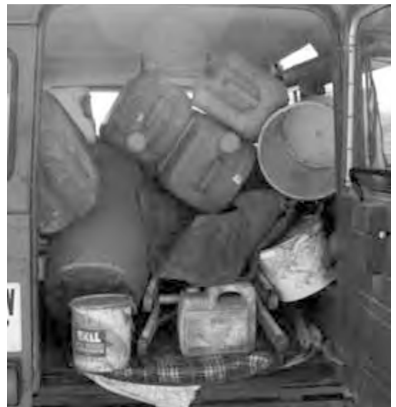
Material recollit als contenidors de Marençà