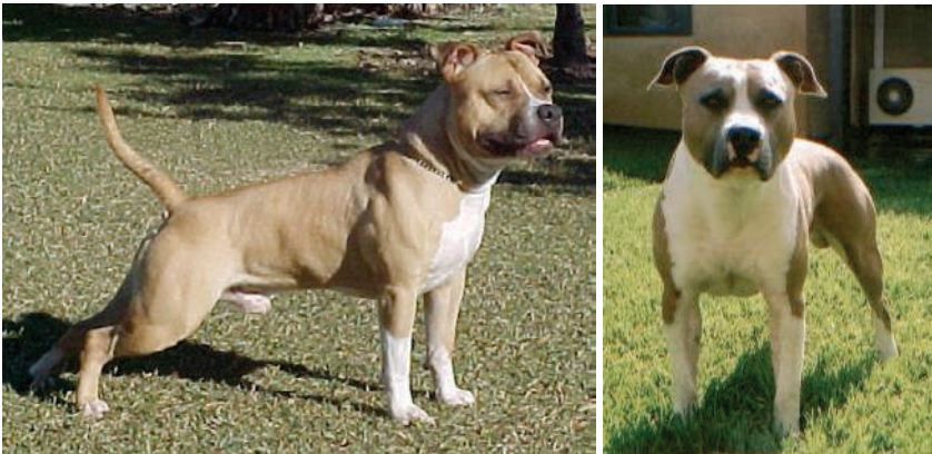
Tosa japonès (o tosa inu)